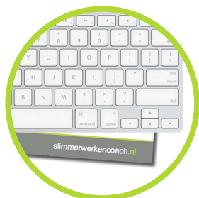
en onder het toetsenbord bewaren