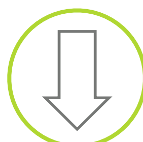
download de nieuwste versies (Apple of Windows, NL of EN) op www.slimmerwerkencoach.nl/sneltoetsen